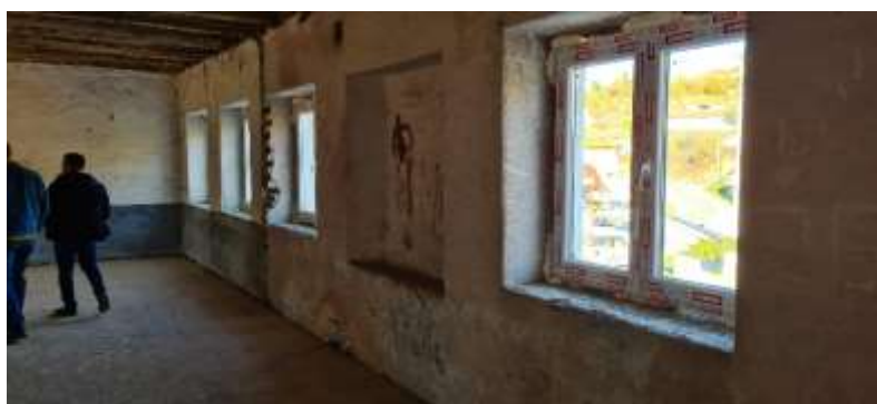
6. Изведба на проектот за Дом на култура – Општина Вевчани