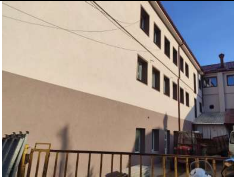
8. Изведба на проектот за ОУ „Санде Штерјоски“ - Општина Кичево