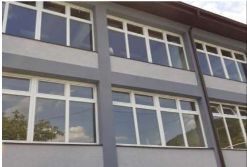
4. Изведба на проектот за ОУ „Христо Узунов“-Охрид