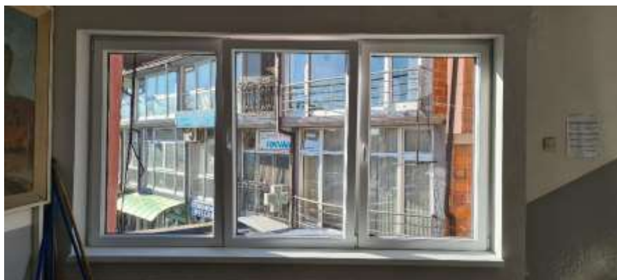
3. Изведба на проектот за ОУ „Ристе Ристески“ во Дебар